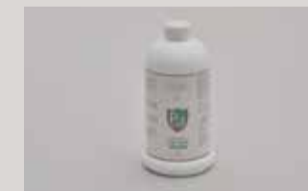
詰替用ビーズガード(PG-L800)800mL